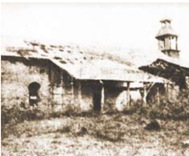
Lado oeste de la iglesia.

Durante este tiempo cambia varias veces de unidad, pasando el 28 de julio de 1899 a la 1.ª Compañía del