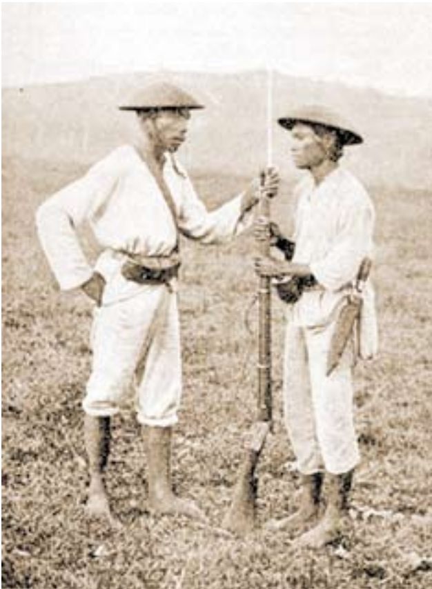
Soldados tagalos.

Soltero y trabajador del campo, en el momento de su alistamiento no sabía firmar, señal evidente de su analfabetismo, de manera que en este punto se nos plantea la duda de si efectivamente la firma recogida en un álbum que, al igual que sus compañeros su-