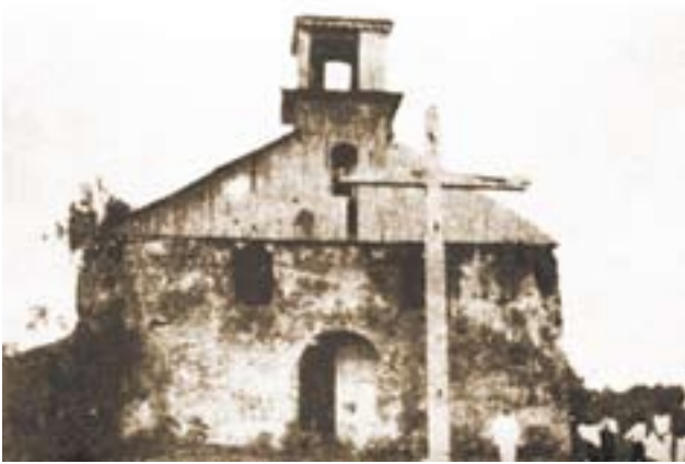
Fotografía de la iglesia de Baler antes del asedio.

franciscanos, lograron sobrevivir tras resistir durante 337 días una fuerza enemiga cuyo número exacto varía según las fuentes, pero que oscila entre los 800 y 1.500 hombres, y de los que 700 resultaron muertos o, sobre todo heridos 19 , si bien este contingente representa el número de soldados filipinos que pasaron por Baler a lo largo de todo su asedio. Allí fueron atacados durante los primeros meses por la disentería y el beriberi, enfermedades que acabaron con la vida de catorce de los defensores y que también hubo de padecer Juan, en tanto otros dos murieron por herida de bala. Hubo, además, a lo largo de todo este tiempo, cuatro desertores y dos fusilados más por intento de desertión. Su negativa a rendirse se