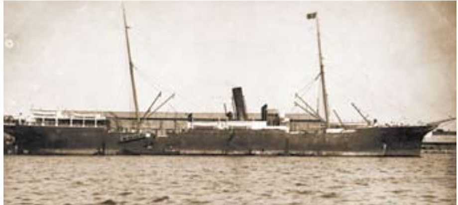
Vapor Alicante

Al igual que sucedió con la inmensa mayoría de los soldados que lucharon en Cuba, Puerto Rico y Filipinas, los héroes de Baler se encontraron, tras un primer momento de relativo y más bien tibio reconocimiento, con un futuro bastante incierto y recibiendo el mayor de los olvidos. Así, si en un primer momento se solicitó la concesión de una Laureada de San Fernando acompañada de su correspondiente paga para todos los supervivientes, lo cierto es que sólo le fue concedida a Saturnino Martín Cerezo, mientras que a los soldados se le otorgaron dos cruces de plata del mérito militar con distintivo rojo y una pensión vitalicia de 7,50 ptas. mensuales cada una, lo que no era mucho para la época.