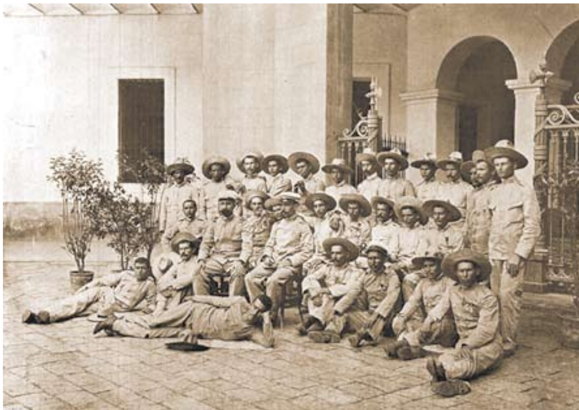
Fotografía de los héroes de Baler en el patio de Capitanía General de Barcelona el 1 de septiembre de 1899.

doles sus condecoraciones a la par que les conminaba a que cesaran en su actitud, tras lo que éstos le miraron, le saludaron militarmente y se marcharon sin que volvieran a importunarlos. Otra situación que nos habla de su carácter tuvo lugar cuando se negó a levantarse ante un teniente de la guardia civil en el momento en que éste entraba en un bar del pueblo, y al que también mostró sus medallas para acallarlo, medallas que, al parecer, siempre llevaba consigo.