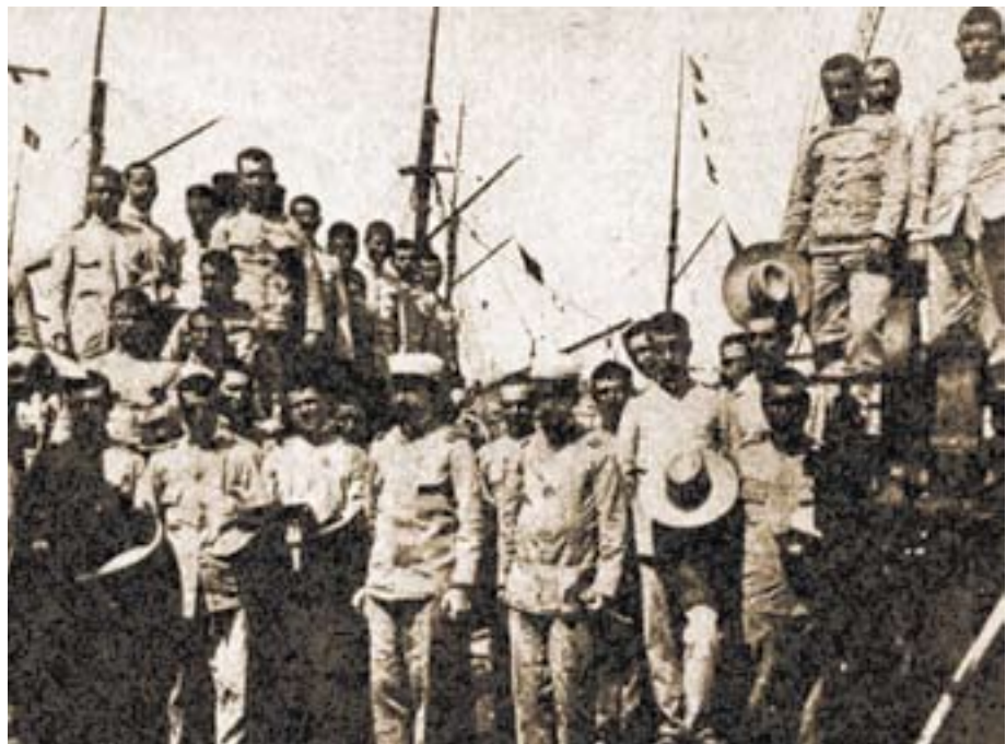
Llegada a Barcelona del vapor Alicante con los repatriados de Baler.

Antes de su partida trabajó como jornalero en el Cortijo del Castellón (Antequera), donde se cuenta que, al ser los jornaleros habitualmente molestados por una pareja de la guardia civil que acudía con cierta frecuencia, un buen día Juan les interpeló enseñán-