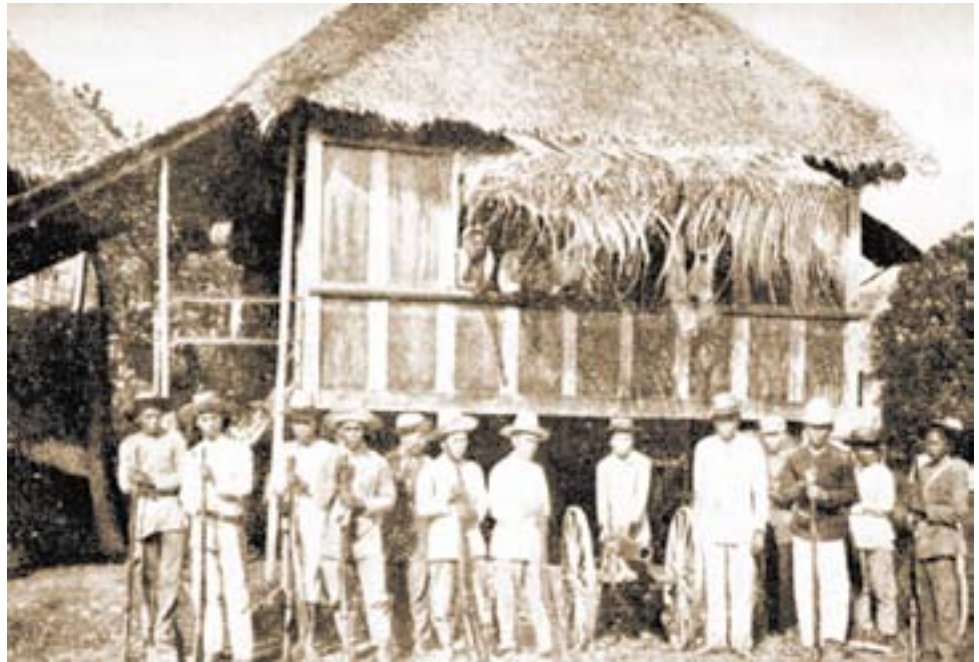
Filipinos en Baler durante el asedio.

dente Emilio Aguinaldo, con todos los honores y miramientos.