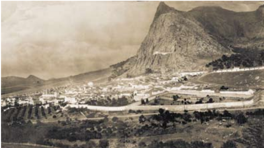
Vista de El Valle de Abdalajís a principios del siglo XX.

que nos permite conocer algunos episodios de su vida y hacernos una idea de su carácter.