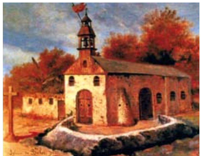
Dibujo de la iglesia de Baler recreando su asedio. (Fuente: Martín Cerezo)