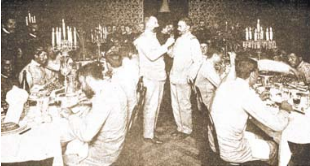
Cena en el Cuartel de San Jaime en homenaje a los héroes.

En 1908, tras un largo proceso y el fallecimiento de alguno de ellos, se concede a los supervivientes una pensión vitalicia de 60 ptas. mensuales que podía transferirse a sus esposas, hijos o padres 35 . Además, debió de gozar del privilegio de ser caballero cubierto ante el rey 36 .