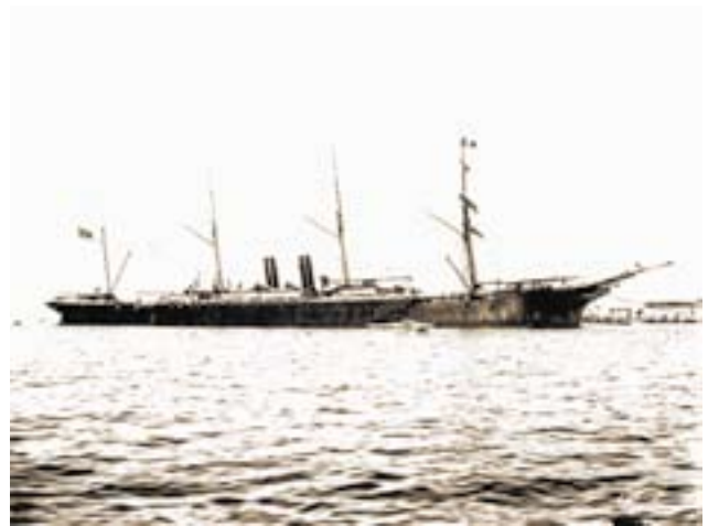
Vapor Colón.

El 7 de febrero de 1898 parte para la localidad de Baler, a donde llega con su compañía el 12 del mismo