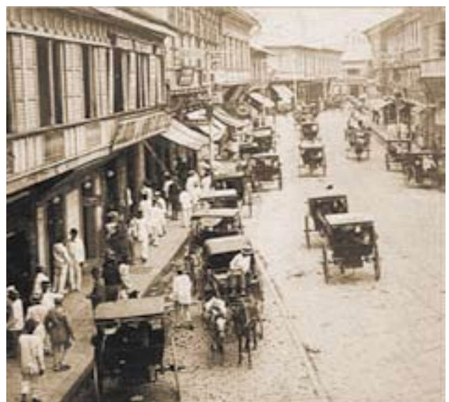
Calle Escolta de Manila, principal centro de negocios de la ciudad, en 1899.

Iniciado el sitio de Baler el 28 de junio, de los 55 soldados españoles, o castila como los llamaban los filipinos, solamente 33 de ellos, junto a dos clérigos