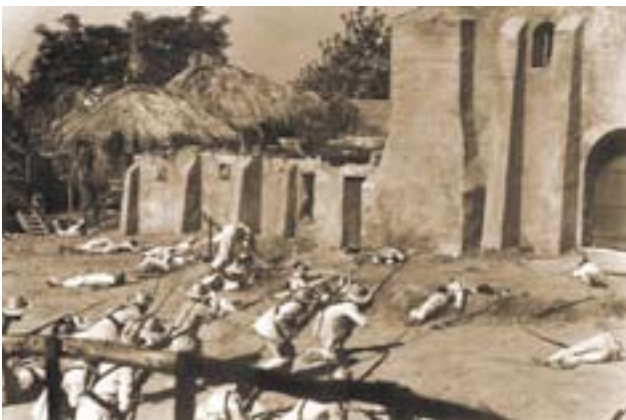
Fotograma de la película Los últimos de Filipinas (1945).

franciscanos, lograron sobrevivir tras resistir durante 337 días una fuerza enemiga cuyo número exacto varía según las fuentes, pero que oscila entre los 800 y 1.500 hombres, y de los que 700 resultaron muertos o, sobre todo heridos 19 , si bien este contingente representa el número de soldados filipinos que pasaron por Baler a lo largo de todo su asedio. Allí fueron atacados durante los primeros meses por la disentería y el beriberi, enfermedades que acabaron con la vida de catorce de los defensores y que también hubo de padecer Juan, en tanto otros dos murieron por herida de bala. Hubo, además, a lo largo de todo este tiempo, cuatro desertores y dos fusilados más por intento de desertión. Su negativa a rendirse se